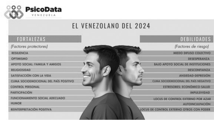
PsicoData (2024): Elaboración propia

A continuación, se presenta a modo resumen la imagen que ilustra los factores protectores y de riesgo de la población general: